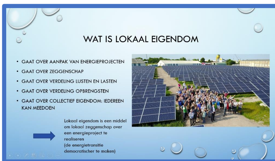
Figuur 1: Wat is lokaal eigendom

De opbrengsten van een project is dat wat overblijft na betaling van kosten, rente en aflossing. Overigens zitten in die laatste categorie ook al opbrengsten verwerkt voor hen die financieel participeren. De hoeveelheid zon of wind en de energieprijis is in belangrijke mate van invloed op het resultaat. De opbrengsten van een project in lokaal eigendom kunnen ingezet worden voor plaatselijke doelen, zoals een gemeenschapsgebouw of de aanleg van glasvezel in het buitengebied. De inwoners en bedrijven die lid zijn van de coöperatie bepalen hoe de opbrengsten besteed worden. Daarbij hoeft het niet uit te maken wie wel of niet zelf geïnvesteerd heeft in het project. Dit is afhankelijk van het gekozen model.