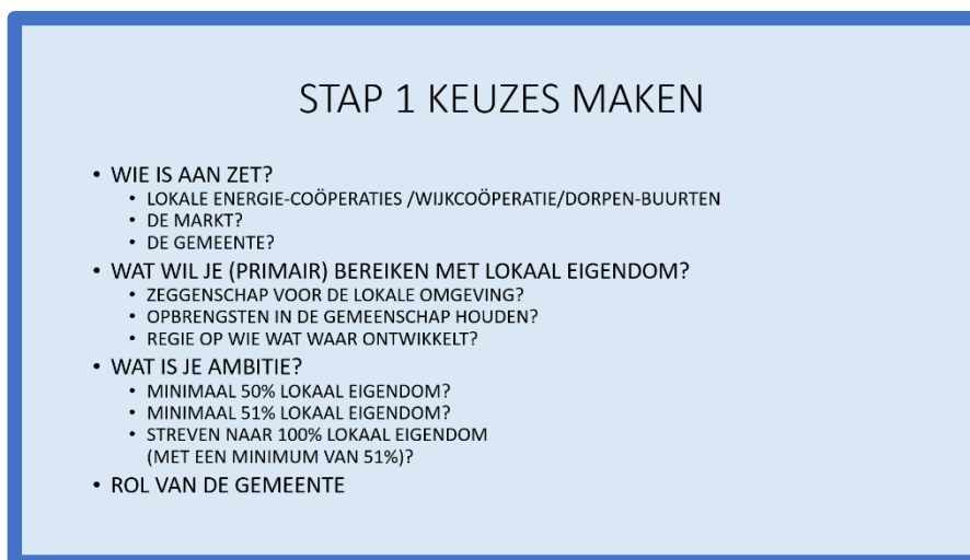
Figuur 4: Schematische weergave stap 1

Deze doelstellingen bepalen vervolgens de beleidsmatige inzet op lokaal eigendom. Het kan overigens prima zo zijn dat een beleidsuitgangspunt per project verschillend uitpakt. Ook bij een streven naar 100% lokaal eigendom is het soms belangrijk projecten met andere verhoudingen in lokaal eigendom, maar bijvoorbeeld met groot draagvlak, te kunnen realiseren.