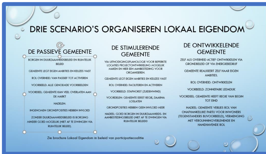
Figuur 4: De drie scenario's.